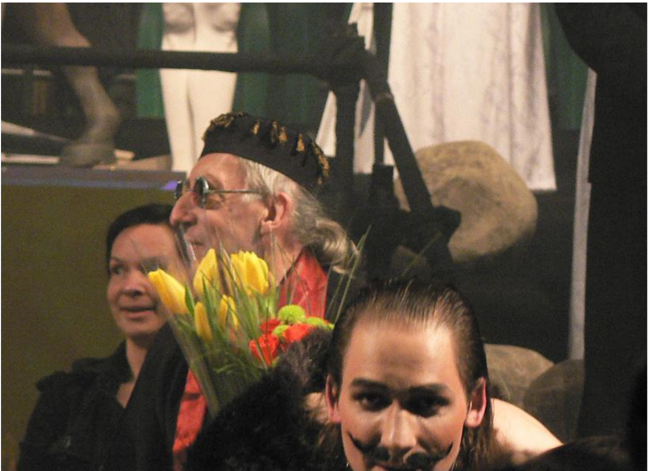
Giedrius Kuprevičius / composer