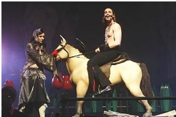
Dali personažas geriausiai atrodo ant vaikiško arkluko.