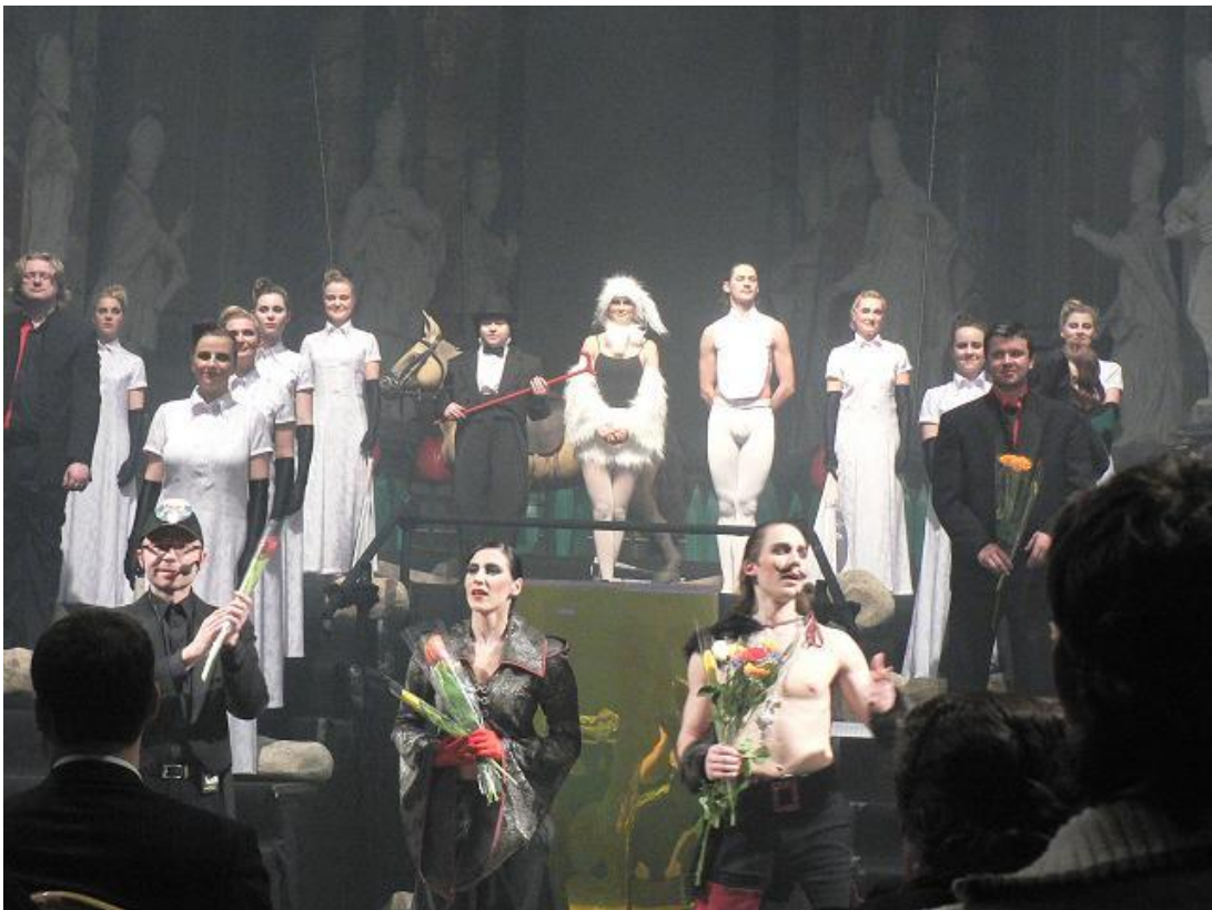
after the premiere